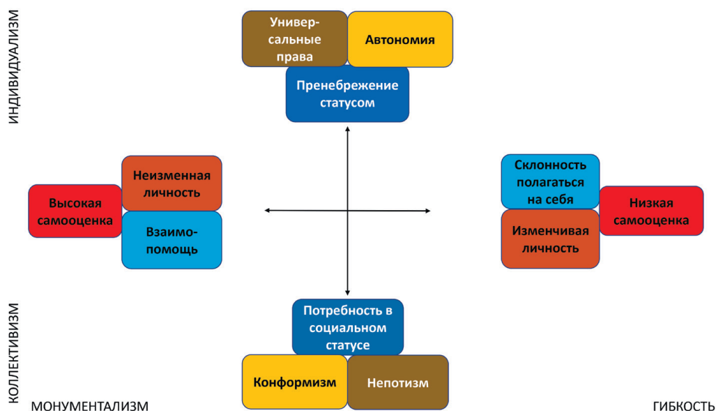
Рис. 2. Основные элементы измерений индивидуализм — коллективизм и гибкость — монументализм

вариант концепции ценностей самовыражения Рональда Инглхарта (Inglehart, Baker, 2000; Inglehart, Welzel, 2005; Инглхарт, Вельцель, 2011) 6 .