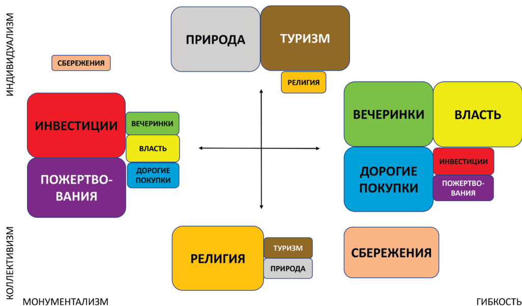
Рис. 4. Культурные различия в финансовых приоритетах

ниях людей, живущих в различных странах, непосредственно соотносится с объективными социетальными различиями между современными государствами. Используя разнообразные индикаторы национального политического, социального и экономического развития, им удалось выявить два измерения объективной культуры, тесно коррелирующие с осями индивидуализма — коллективизма и монументализма — гибкости (рис. 5).