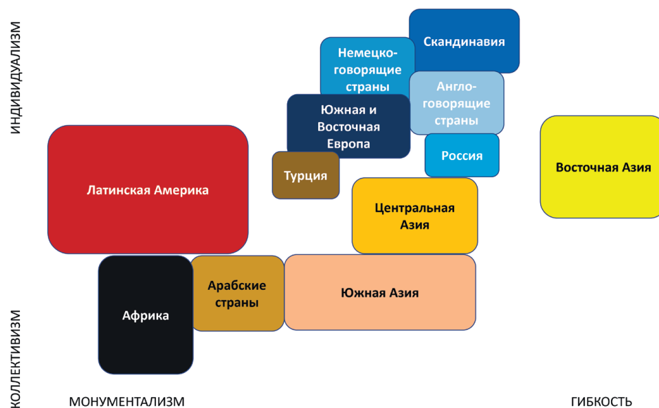
Рис. 1. Культурная карта мира Минкова-Хофстеде

Рисунок 2 суммирует элементы двух основных осей карты Минкова-Хофстеде. Прямоугольники, закрашенные одним и тем же цветом, обозначают противоположные полюса отдельных составляющих этих измерений. Например, коллективистские культуры характеризуются высоким уровнем nepoтизма (прямоугольник коричневого цвета снизу справа на вертикальной оси), то есть кумовства или — в более общем смысле — нормальности дискриминации в различных сферах представителей групп, внешних по отношению к группе индивида — семье, роду/клану, этносу или территориальному сообществу. Члены индивидуалистических сообществ, напротив, полагают, что все люди пользуются равными правами и поэтому дискриминация по каким-либо признакам групповой принадлежности при распределении общественных благ и во всех прочих областях недопустима.