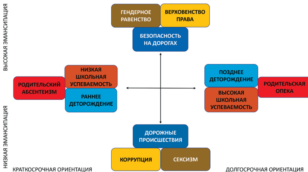
Рис. 5. Ключевые аспекты межстрановых различий в объективной культуре